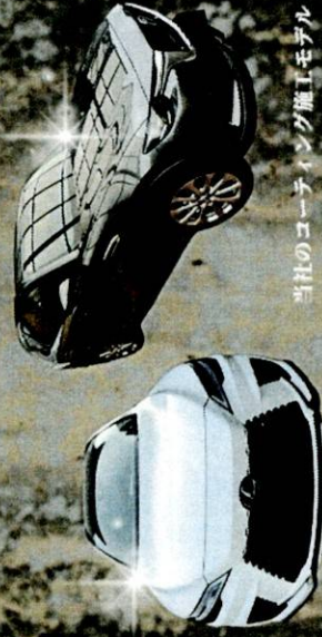
当社のコーティング施工モデル