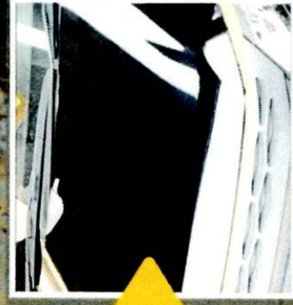
白ボケがなくなり、くっきりとした印象に